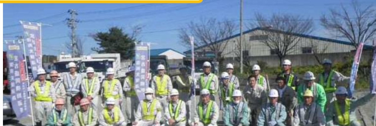
道中、声をかけてくださった皆さん、ありがとうございました！