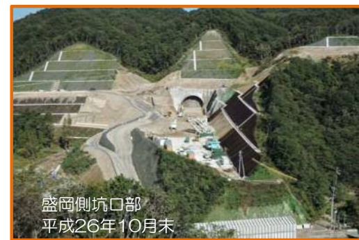
盛岡側坑口部 平成26年10月末