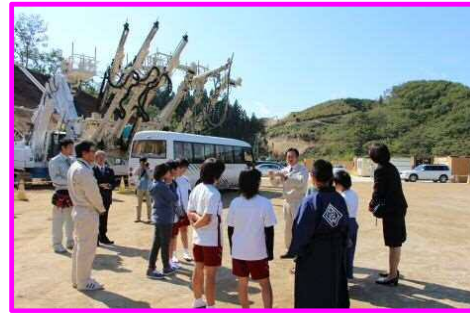
↑ 花輪小学校の児童の皆様にも、工事の概要や建設機械を紹介。また、見学に来てくださいな。