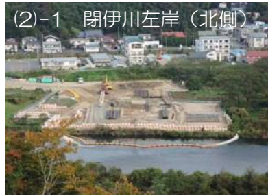
④施工：前田建設工業