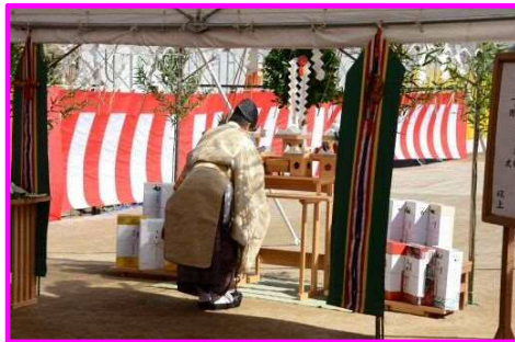
↑ 横山八幡宮の花坂宮司を祭主として神事を行いました。