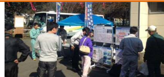
「楽しみにしています。」と笑顔をいただきました。