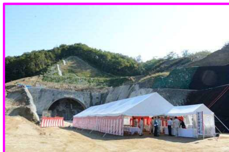
↑ 小山田トンネル盛岡側坑口です。当日は、好天に恵まれました。

安全祈願祭は、施工会社である前田建設工業（株）が主催し、来賓、関係者、地域住民、および花輪小学校の児童の皆様を含め、約80名が参加しました。