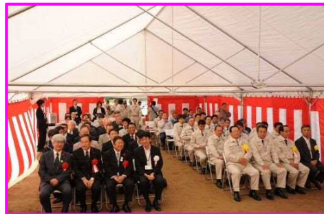
↑ 大勢の方に参加いただきました。