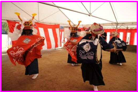
↑ 花輪小学校の児童の皆様が「花輪鹿子（しし）踊り」を披露し、激励してくださいました。